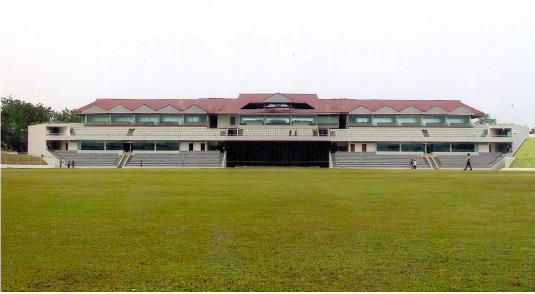
গ্র্যান্ড স্ট্যান্ড ফিল্ডসাইড সিলেট বিভাগীয় স্টেডিয়াম