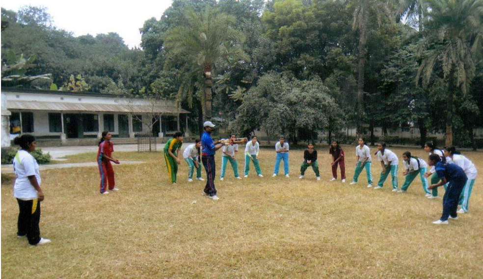
ঢাকা জেলা ক্রীড়া অফিস আয়োজিত মাসব্যাপী ক্রিকেট প্রশিক্ষণের দৃশ্য

ক্রীড়া পরিদপ্তর অটিস্টিক ও স্নায়ুবিকাশজনিত সমস্যা বিষয়ে ক্রীড়া সচেতনতা সৃষ্টির জন্য ২০১৪-২০১৫ অর্থবছরে বিভিন্ন কর্মসূচি গ্রহণপূর্বক বাস্তবায়ন করে। অটিজম শিশুদের নিয়ে সেমিনার ও উদ্বুদ্ধকরণ কর্মসূচি, অটিজম শিশুদের নিয়ে মনোজ্ঞা ডিসপ্লে প্রদর্শনও তাদের জন্য খেলাধুলার আয়োজন করা হয়।