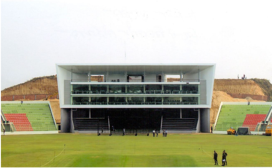
মিডিয়া সেন্টার সিলেট বিভাগীয় স্টেডিয়াম