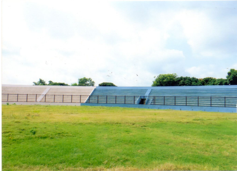
চুয়াডাঙ্গা স্টেডিয়াম গ্যালারী