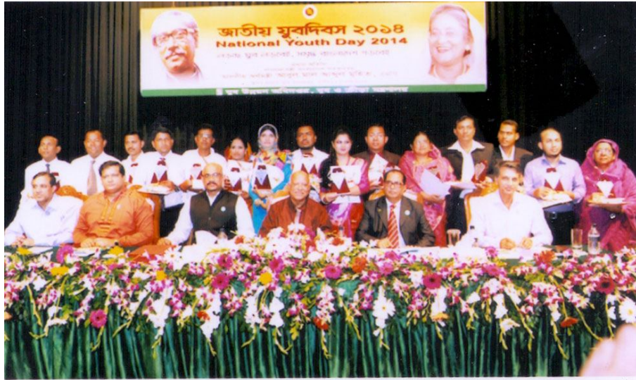
অতিথিবৃন্দের পিছনে জাতীয় যুবপুরস্কারপ্রাপ্ত ১৫জন সফল যুব ও সংগঠক

দেশের যুবসমাজের মধ্যে সচেতনতা সৃষ্টি ও জাতীয় উন্নয়নমূলক কর্মকাণ্ডে তাদেরকে সম্পৃক্ত করার লক্ষ্যে প্রতি বছর জাতীয় যুব দিবস যথাযোগ্য মর্যাদায় উদযাপন করা হয়। যে সকল প্রশিক্ষিত সফল যুবক ও যুবমহিলা আত্মকর্মসংস্থান প্রকল্প স্থাপনে দৃষ্টামত্মমূলক অবদান রাখতে সক্ষম হন, তাদেরকে জাতীয় যুব দিবসে জাতীয় যুব পুরস্কার প্রদান করা হয়। ২০১৪-২০১৫ অর্থ বছরে ১৫ জন সফল যুবক ও যুবমহিলাকে জাতীয় যুব পুরস্কার প্রদান করা হয়। এ যাবৎ ৩৩০ জন সফল যুবক ও যুব মহিলাকে জাতীয় যুব পুরস্কার প্রদান করা হয়েছে।