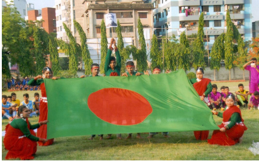
অটিস্টিক শিশুদের মনোজ্ঞা ডিসপ্লে