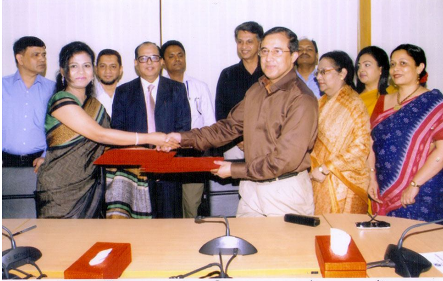
যুব উন্নয়ন অধিদপ্তরের সাথে এসোসিয়েশন অব গ্রাসরুটস ওমেন এন্টারপ্রেনারস, বাংলাদেশ (এজিডবিউইবি) -এর মধ্যে সমঝোতা স্মারক স্বাক্ষরিত

যুব কার্যক্রমকে আরো জোরদার ও গতিশীল করার লক্ষ্যে জাতীয় ও আন্তর্জাতিক বিভিন্ন সংস্থার সাথে সমঝোতা স্মারক স্বাক্ষর করা হয়। ২০১৪-২০১৫ অর্থ বছরে ০৯ টি সংস্থার সাথে সমঝোতা স্মারক স্বাক্ষর করা হয়েছে।