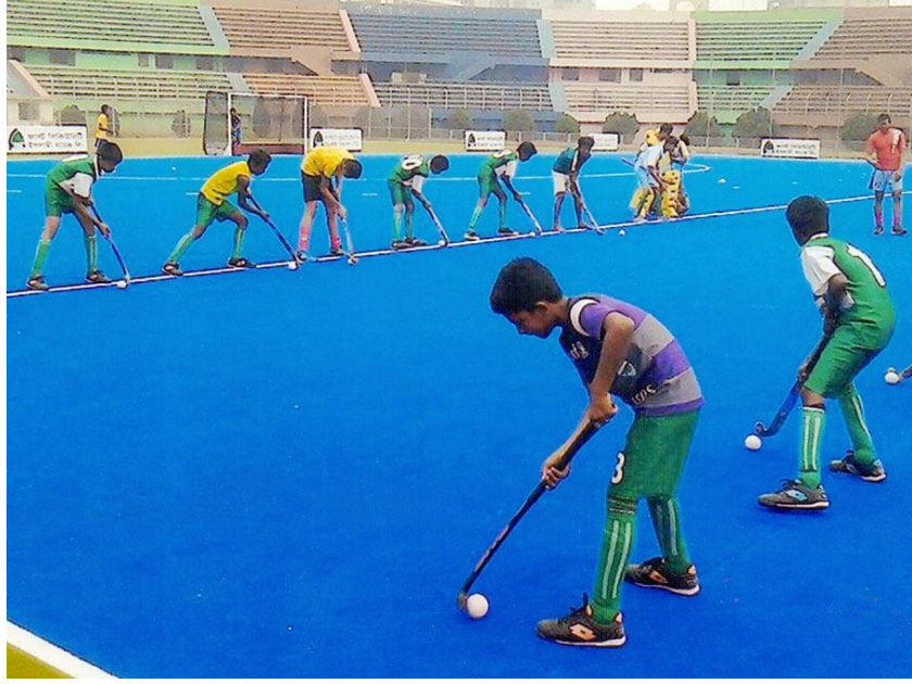
ঢাকা জেলা ক্রীড়া অফিস আয়োজিত মাসব্যাপী হকি প্রশিক্ষণের দৃশ্য