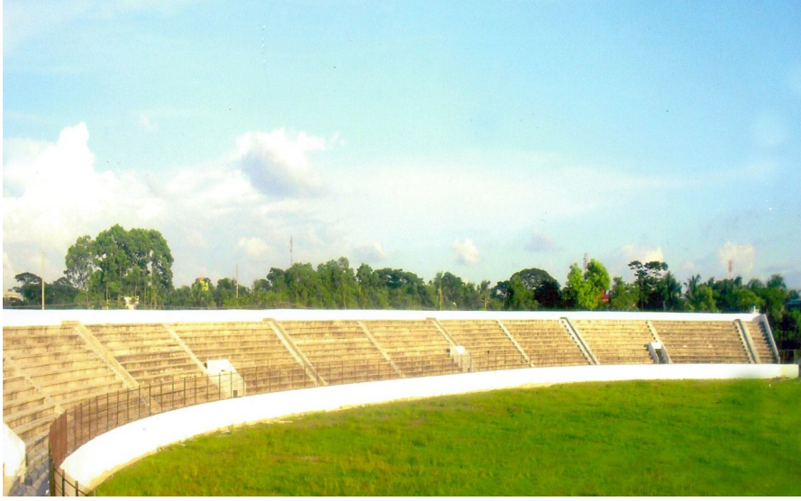
হবিগঞ্জ জেলা স্টেডিয়াম